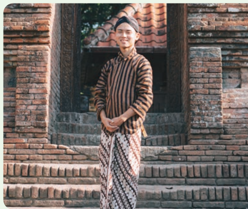
ジャワの伝統的な衣装