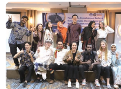
留学生仲間との記念写真（前列向かって一番左）

大学では外国人向けのインドネシア語コース（BIPA）を受講しました。授業は週に4日で、座学だけでなく伝統的な文化を体験できる実践的な学びも多かったです。また、アフリカ、ヨーロッパ、アジアなど世界中から留学生が集まっていたので、国際色豊かな環境でした。現地では学生アパートを借りていましたが、場所によってはお湯が出ない、エアコンがない、窓がない、などの物件も多いので注意が必要です。放課後や休日は、現地の友人や他の留学生仲間と一緒に課題をしたり、遊びに行ったりすることが多かったです。また、祭日には友人の家を訪れて現地の人々のリアルな暮らしを体験することもできました。特にラマダーン月に友人と共に断食を経験した時には、当たり前だと思っていた水や食事のありがたさを実感する特別な経験ができました。