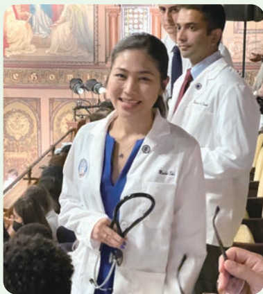
入学時の白衣授与式