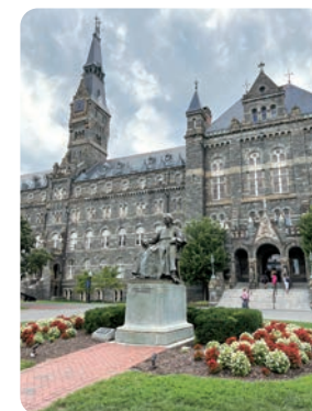
ジョージタウン大学

米国籍の無い日本人の米国医学部入学は、大学時代から多くの人に不可能だと言われてきました。しかし私は、米国医科大学協会が毎年公表するデータを見て事実を確かめ、僅かな可能性に賭けて挑戦を続けました。前例の乏しいことに挑戦する時には「出来ると信じること」、それ以外に不可能を可能にする方法はないと思います。