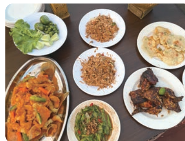
注意：辛い料理が多いです

インドネシアでの留生活は、慣れない環境や食文化に戸惑うこともあるかもしれませんが、しかし、その分だけ日常の中で驚きや発見があり、心に残る瞬間がたくさん待っています。見たことのない食べ物、経験したことのないイベント、さまざまなことに挑戦し、たくさん成長できる留生活となることを祈っています。