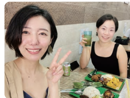
友人とシンガポール名物ナシレマ (左)

毎週プレゼンを作り録画し、毎週エッセーを書き、さらにクラスメイトのプレゼンを見てから授業に臨むというのはかなりハードでしたが、その分貴重な修行になったと今では思います。その中で支えとなったのはやはりクラスメイトの存在でした。昼前にみんなでジムに行き、昼から日付が変わるまで大学で黙々と課題に取り組む。一人だったら絶対に乗り越えられないようなことでも、誰かと一緒に取り組めば自分はいくらでもできるんだ！と自信をつけさせてもらえました。