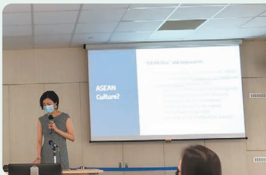
学期末の研究進捗発表にて筆者