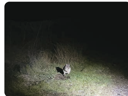
夜の山で出会った小型有袋類

単語帳というひとたすら文章を読んで使うことがほとんどだと思うのですが、私は単語の横にその意味を表す絵を描いたりして、一瞬で使える場面を思い出せる様に工夫していました。また、英語の番組を見て楽しみながら学ぶことも長続きに繋がりました。まずは日本語字幕で、何回も聞こえてくる単語の発音をコンテキスト付きで自然に学んでいき、だんだんと英語字幕、そして字幕なしに設定を変えていきました。