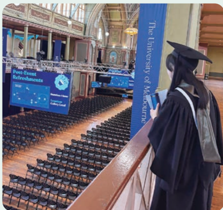
メルボルン大学の卒業式